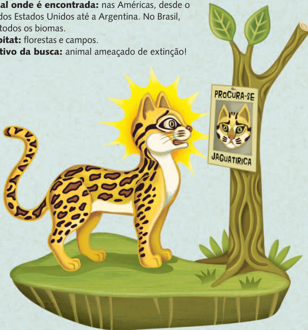
Ilustração Mario Bag

Motivo da busca: animal ameaçado de extinção!